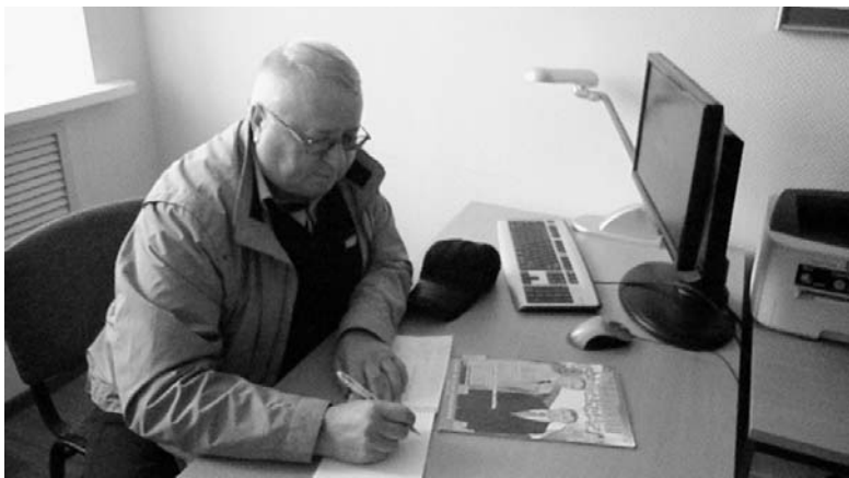
В комнате приема граждан есть все необходимое.

Материалы подготовил С. НЕФЕДОВ.