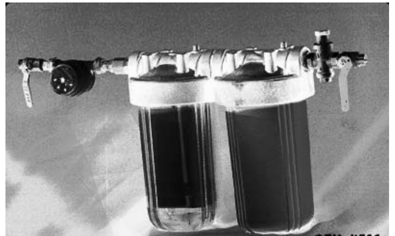
ТЕМА ВЫПУСКА: ФИЛЬТРЫ ДЛЯ ОЧИСТКИ ВОДЫ

Как же понять, какой фильтр нужно приобретать в конкретном случае? Для этого необходимо сначала провести анализ воды, которую ему придется очищать. Только так можно понять, с чем именно придется «столкнуться» фильтру в процессе работы.