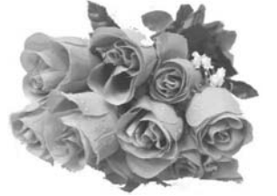
Жена, сын, сноха, теща.

Поднимем бокалы и выпьем до дна – Ведь каждому жизнь, как награда, дана. И в твой юбилей сказать тебе рады, Что жизнь тебя нам подарила в награду! Сегодня родные желают с любовью Тебе много счастья, удач и здоровья. И верят, что жизнь твоя будет всегда Полна благородства, надежд и труда!